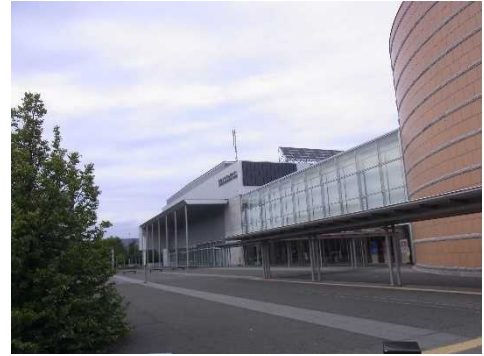
コンベンションセンター