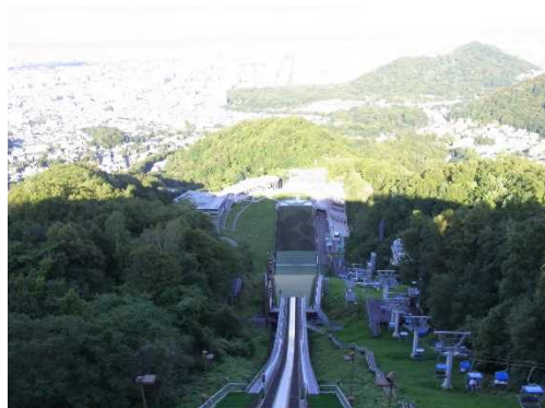
大倉山ジャンプ競技場